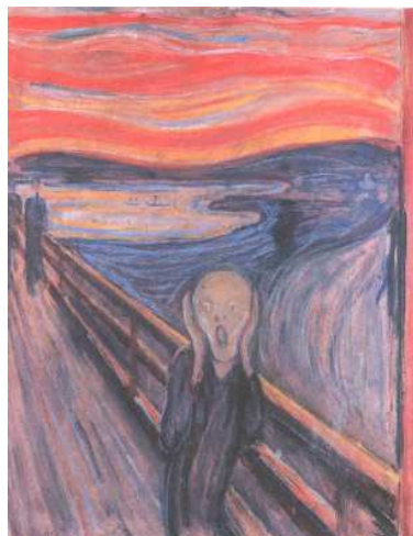
'De schreeuw' van Edvard Munch